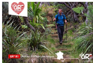
GR® R1 La Réunion