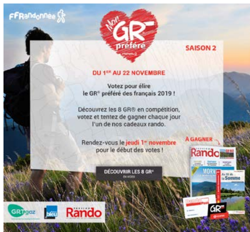
Page d'accueil du jeu