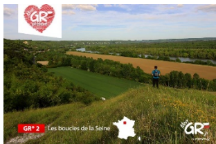
GR® 2 - Vallée de la Seine en Ile de France Paris - Hauts de Seine - Yvelines - Eure Ile de France - Normandie

Du 1er au 22 novembre 2018, 8 nouveaux GR® candidats au titre de GR® préféré des français