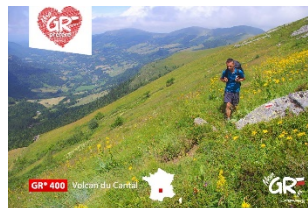
GR® 400 - Tour des Volcans d'Auvergne Cantal Auvergne-Rhône-Alpes