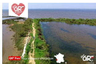
GR® de Pays Tour du Bassin d'Arcachon Arcachon Nouvelle-Aquitaine