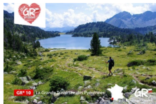
GR® 10 - Traversée des Pyrénées Hautes-Pyrénées Occitanie