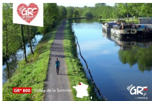
GR® 800 - Au fil de la Somme Somme Hauts de France