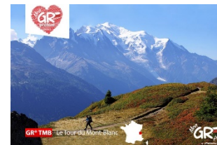
GR® Tour du Mont-Blanc Haute-Savoie Auvergne - Rhône-Alpes