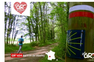
GR® 654 - St Jacques de Compostelle, via Vézelay Dordogne Nouvelle Aquitaine